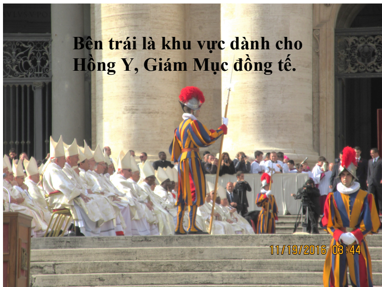
Bên trái là khu vực dành cho Hồng Y, Giám Mục đồng tế.

nói lên sự chiến thắng của Chúa là vua vũ trụ (hôm nay cũng là lễ Chúa Kitô Vua, kết thúc năm Phụng Vụ); Bên phải chúng ta là bức tranh thêu hình Thánh Giuse bồng chúa Giêsu với hàng chữ tiếng latin: TU ERIS DOMUM MEAM, tạm dịch: Ngài là Đấng chăm sóc gia nghiệp con! Bức tranh nói lên niềm tin thác Giáo Hội vào Thánh cả Giuse là dưỡng phụ của Chúa Giêsu. Ngài bảo vệ Giáo Hội như đã bảo vệ Chúa.