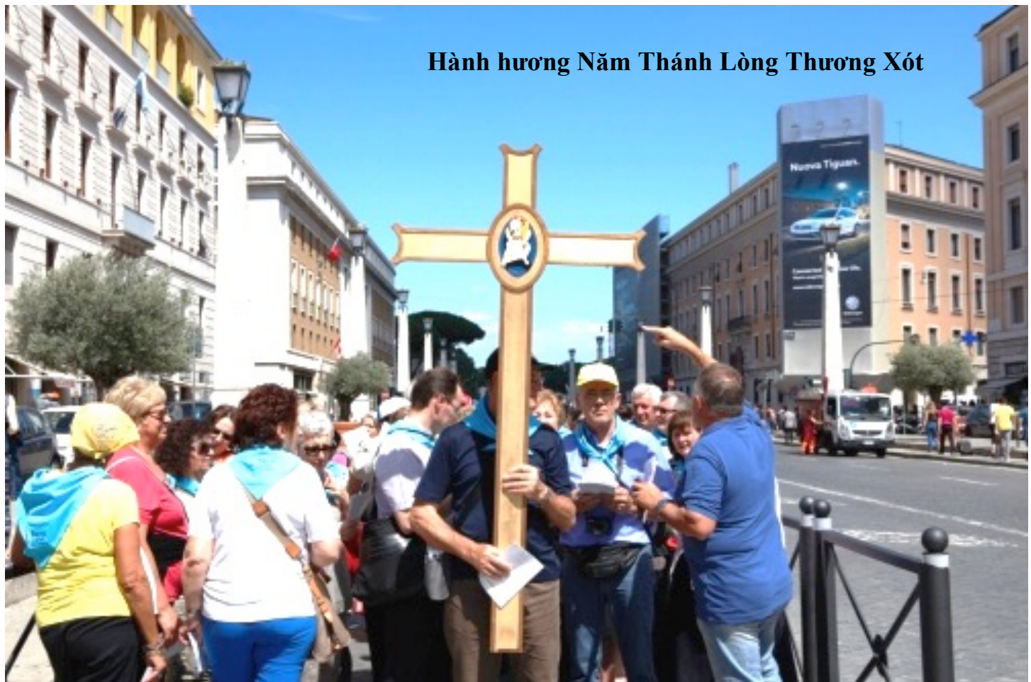
Hành hương Năm Thánh Lòng Thương Xót