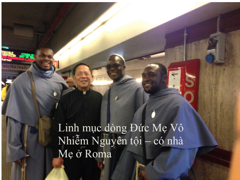
Linh mục dòng Đức Mẹ Vô Nhiễm Nguyên tội – có nhà Mẹ ở Roma

ý Luis Antonio Tagle của Phi luật Tân, được bằng khen đầu tiên... sau đó là linh mục, nữ tu, giáo dân và có cả một người đàn bà đang ngồi xe lăn. Đức Giáo Hoàng xuống tận nơi trao bằng khen thưởng.