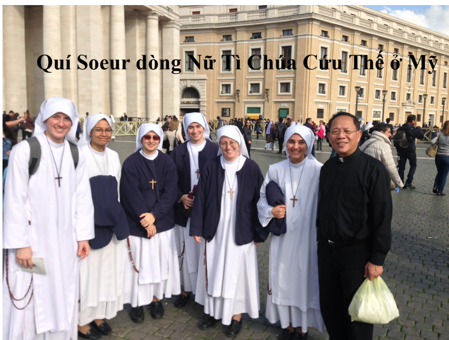
Quý Soeur dòng Nữ Tì Chúa Cứu Thế ở Mỹ