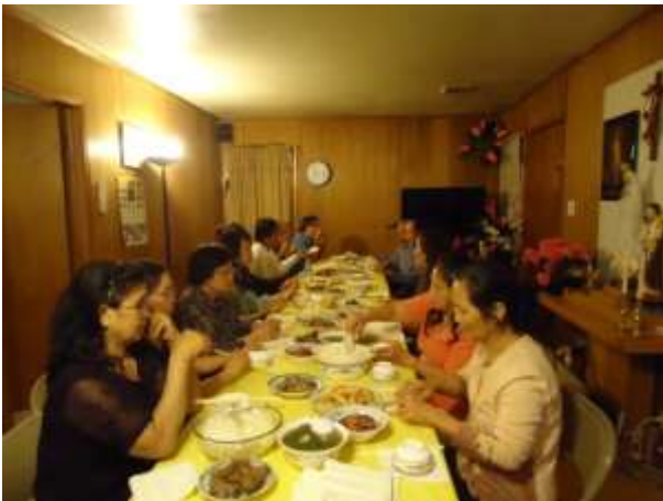
Bữa cơm thân mật...

Chia sẻ câu hỏi: “Bạn đã loan báo tin mừng Phục Sinh bằng cuộc sống bạn ra sao?” Anh Nghiễm trả lời: Chúng ta cố gắng thực hành sống, (a) Đừng nói xấu anh em, đừng nói xấu người thứ ba, tại sao mình không nói với họ, họ nề mình luôn, các anh chị thử tập xem. (b) còn phạm thêm tội vì không những 1 người nghe mà 1, 2, 3, 4 và nhiều người nghe nữa thì mình bị bấy nhiêu tội.