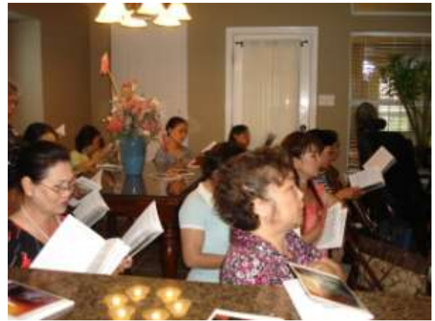
Thư ký Gia Đình Arlington, TX