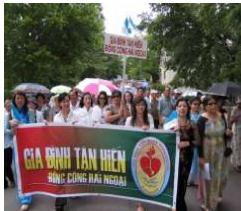
GDTHĐC tham gia kiệu Mẹ NTM 2011