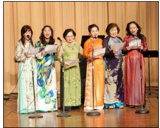
Các Chị Từ Port Arthur: Cô Gái Việt

Những ngày Tĩnh Huân năm nay có những điều mới, thứ nhất là vì có một số em thiếu nhi đi theo cha mẹ nên có cha Thắng, một cha mới toanh và là Mỹ con sẽ có chương trình nói chuyện với các em trong lúc cha mẹ các em tĩnh tâm và thầy Thứ phụ trách sinh hoạt với các em.