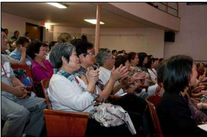
Vui Vẻ Thương Thức