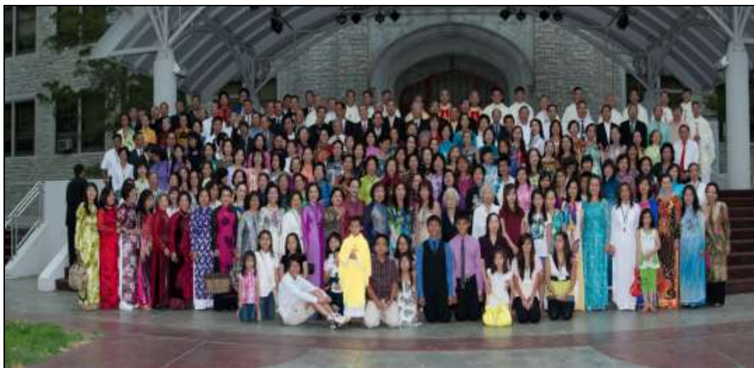
Khóa Tĩnh Huấn 40 HK Tại Carthage, MO

Số Anh Chị tham dự khóa 40HK là 223 người trong đó có 59 Anh Chị đã tận hiến cho Mẹ trong khóa này. Số Anh Chị tham dự khóa 41HK là 118 người, trong đó có 26 Anh Chị đã tận hiến cho Mẹ trong khóa này. Xin Quý Anh Chị tiếp tục cầu nguyện cho tất cả các Anh Chị đã tận hiến và chính thức gia nhập GDTHĐC luôn hăng say sống tinh thần tận hiến và sống theo gương Mẹ Maria. (Xin Quý Anh Chị xem bản tường trình cho biết thêm chi tiết).