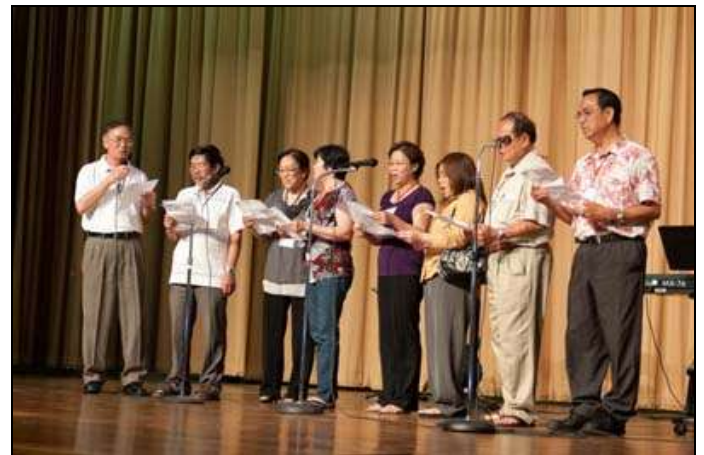
Gia Đình Minnesota: Hò Dô Ta