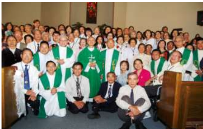
Khóa Tĩnh Huấn 41 HK tại Riverside, CA