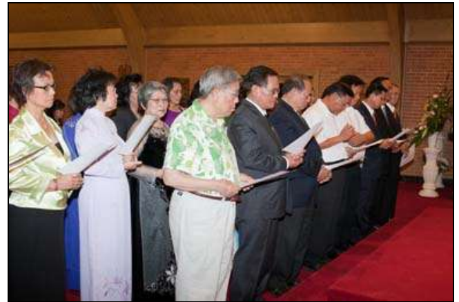
59 Anh Chị Tận Hiến Cho Mẹ

cha tiếp chúng con như thế này chắc chúng con lên ký quá.