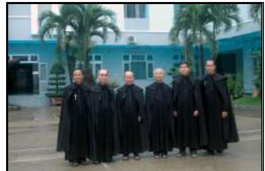
Tân Hội Đồng Phục Vụ