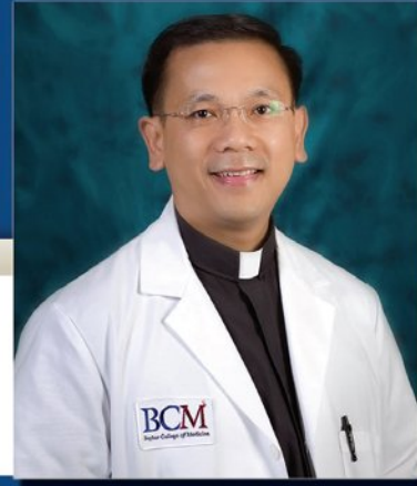
Linh Mục Bác Sĩ