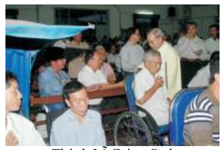
Thánh Lễ Giáng Sinh cho Anh Chị Em khuyết tật