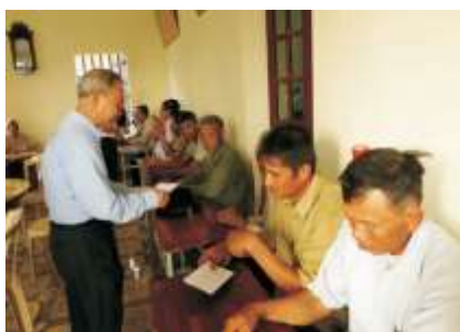
Ủy lạo bão tại giáo họ Xuân Trường Bùi Chu