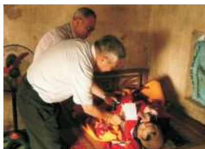
Thăm viếng gia đình nghèo tại Giáo Xứ Đức Long, Thái Bình