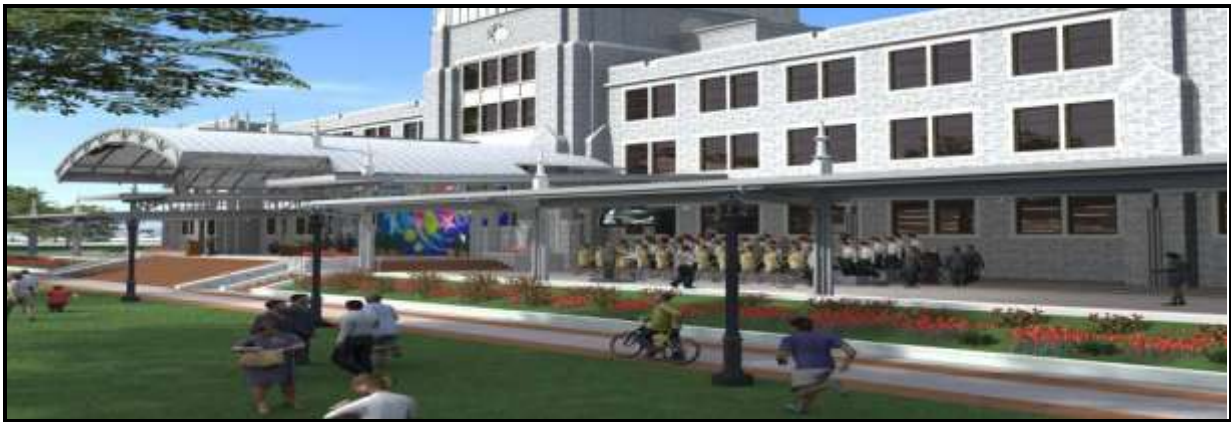
Bản vẽ thiết kế hai mái dài hai bên Lễ Đài Chính của Ngày Thánh Mẫu