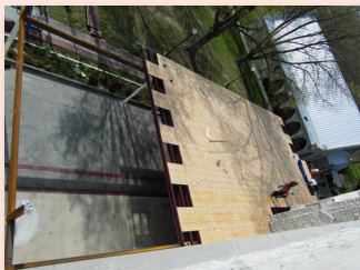
Các thợ đang lợp mái...