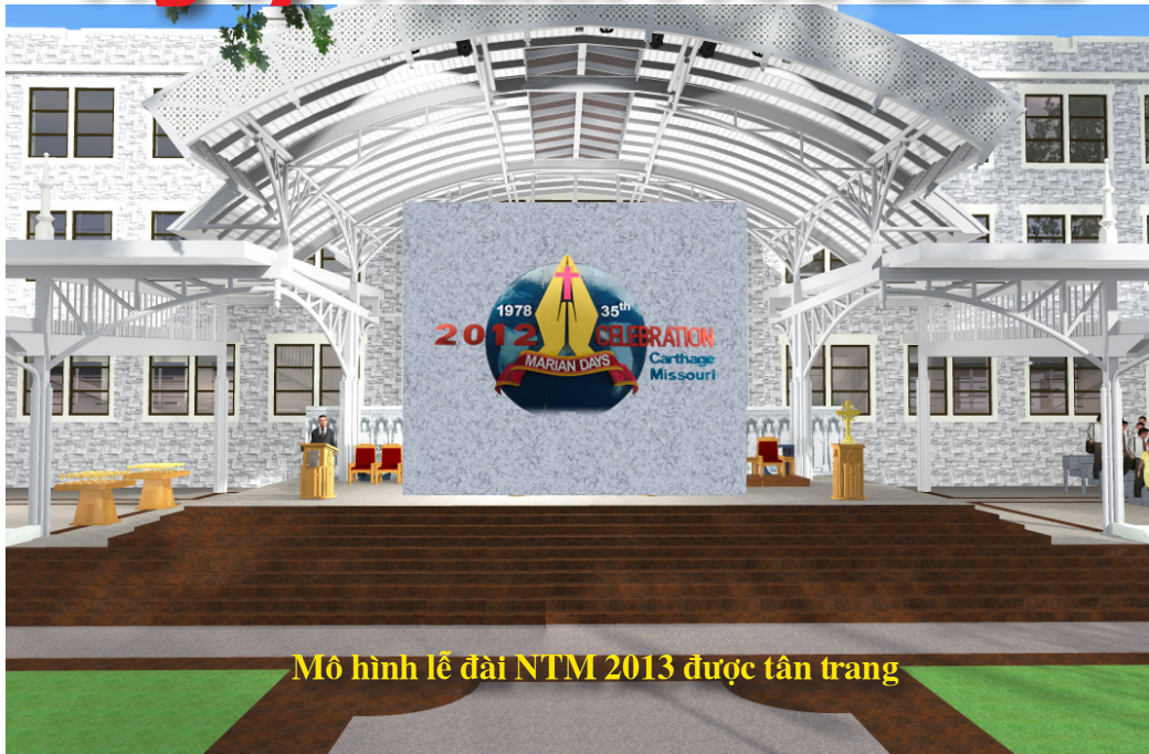
Mô hình lễ đài NTM 2013 được tân trang

Từ Thứ Năm, Ngày 8 Tháng 8 Đến Chúa Nhật, Ngày 11 Tháng 8 Tại Carthage, Missouri, USA