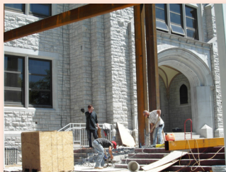
Dời bỏ bức tường nhỏ...