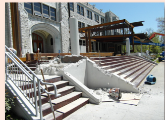
Dời bỏ bồn hoa...