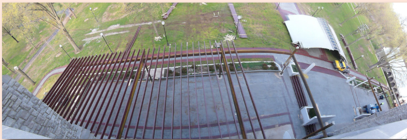
Các đà sắt cho mái hiên mới

Quý vị tham dự Ngày Thánh Mẫu năm nay sẽ thấy một lễ đài, như Quý Vị thấy trên trang đầu, mới được tân trang với mái dãi hai bên lễ đài chính là nơi dành cho các linh mục đồng tế và ca đoàn. Như chúng tôi đã thông báo trong các bản thông tin trước, mục đích làm thêm hai mái này là đề phòng khi thời tiết xấu như trời mưa bất chợt, các diễn tiến quan trọng như các Thánh Lễ Đại Trào hay những sinh hoạt khác tại lễ đài vẫn có thể được diễn ra an toàn và đúng giờ. Một điều đáng kể nữa là sau khi nhận được ý kiến của nhiều người tham dự, Ban Kiến Thiết NTM cũng đã cho sửa chữa lại khu lễ đài chính đó là dời 2 cột phía trước lễ đài và 4 bồn hoa lớn trước và sau lễ đài, vì 2 cột xi măng phía trước và các bồn hoa choáng lấp một khoảng lớn khiến nhiều anh chị em không nhìn được những diễn tiến trên lễ đài. Sau đây là một vài hình ảnh công trình tân trang lễ đài: